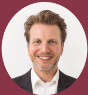
» Simon Schäfer-Stradowsky Institut für Klimaschutz, Energie und Mobilität e.V.