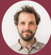
» Hannes Doderer Institut für Klimaschutz, Energie und Mobilität e.V.