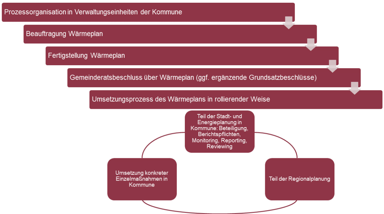
Abbildung 2: Prozess der kommunalen Wärmeplanung; eigene Darstellung nach (Ministerium für Umwelt, Klima und Energiewirtschaft Baden-Württemberg 2020)