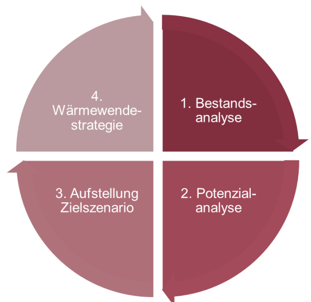
Abbildung 1: Schematische Darstellung der Elemente der kommunalen Wärmeplanung

Die kommunale Wärmeplanung als solche, aber auch als Teil der nachhaltigen Stadtentwicklung bietet die Möglichkeit soziale Aspekte der Wärmewende strukturiert und zielgerichtet zu adressieren. Der Prozess der Wärmeplanung gliedert sich in vier zentrale Elemente (s. Abbildung 1). Die Abbildung verdeutlicht, dass die kommunale Wärmeplanung nicht mit der Erstellung einer Wärmewendestrategie abgeschlossen ist, sondern dass auch die Strategie im Rahmen des rollierenden Wärmeplanungsprozesses immer wieder überprüft und angepasst werden kann bzw. muss. Zentrale Inhalte der einzelnen Prozessschritte sind in Kapitel 3 beschrieben.