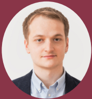
» Roman Weidinger Institut für Klimaschutz, Energie und Mobilität e.V.