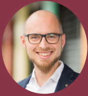
» Benjamin Köhler Öko-Institut e.V.